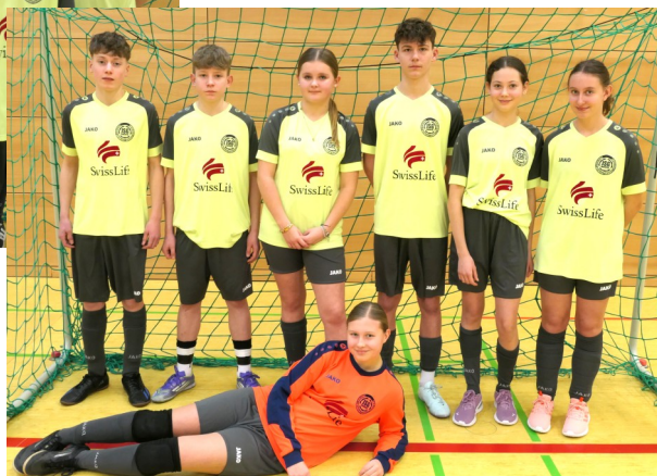
Die beiden Teams beim KonfiCup