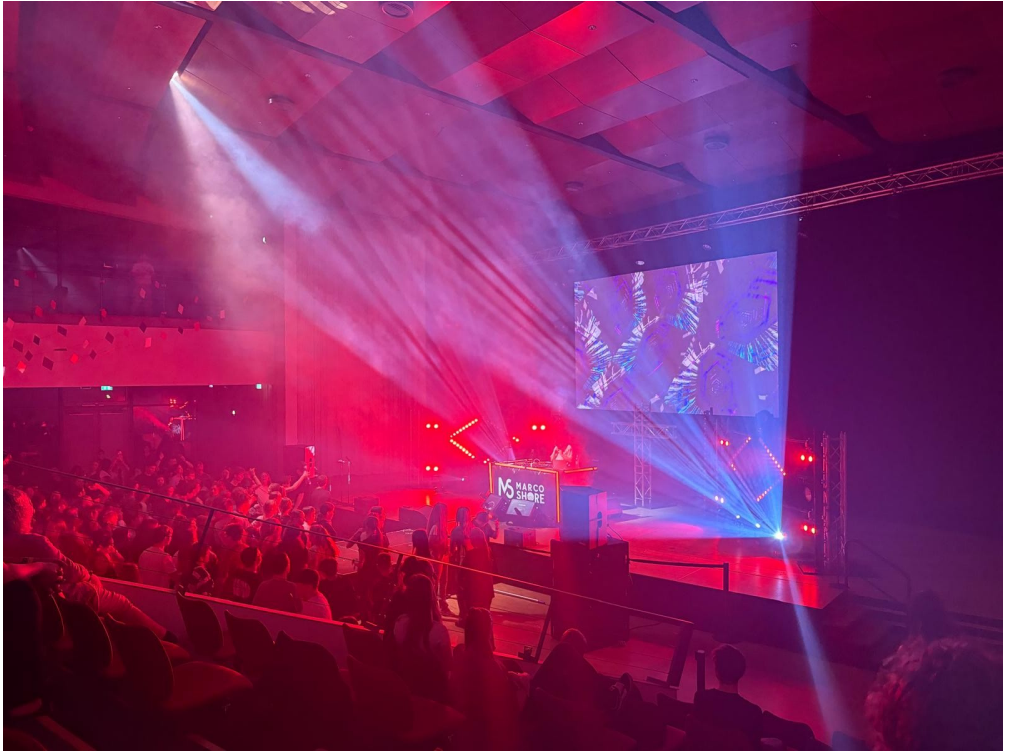
Gute Stimmung bei der „Api Rave Night“,

von den württembergischen Apis organisierten Konfirfreizeit teilnahmen, anwesend.