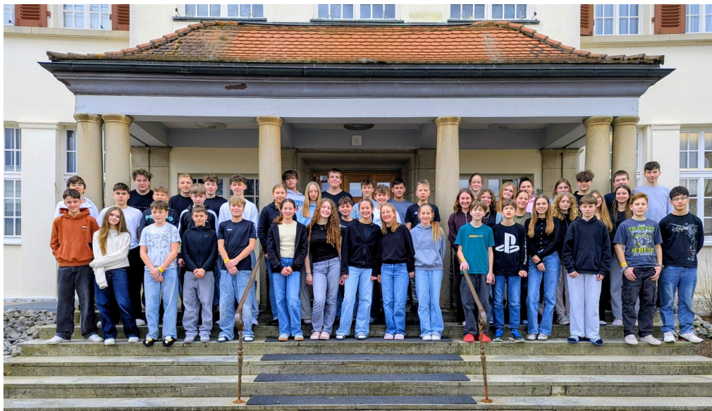
Kraichtaler Konfis vor dem Haus Schönblick

Und nachdem die Zimmer verteilt und bezogen waren, gab es auch schon ein erstes Abendessen. Im Haus Schönblick waren mit unserer Gruppe gut 500 Konfis und 130 Betreuerinnen und Betreuer, die an der