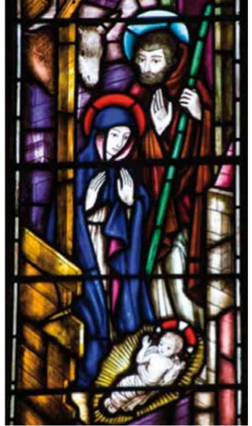
Das Jesus-Kind, mit Maria und Josef.

Ein Kind: denn Gottes Liebe zu seiner Schöpfung ist nicht gewalttätig oder dominant, sondern sanft und zart und verletzlich.