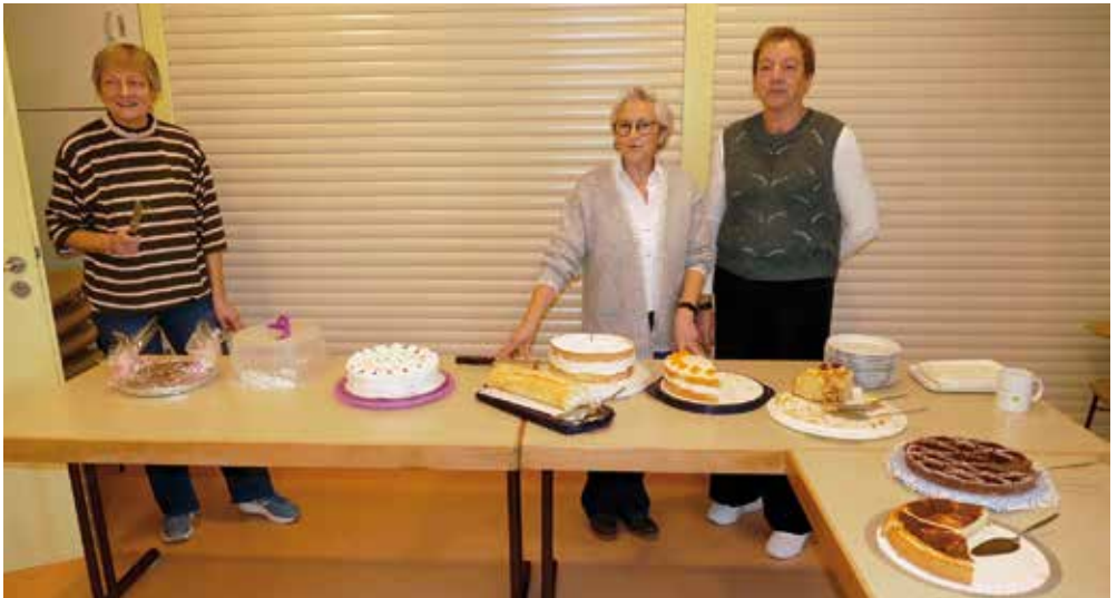
Reichliche Auswahl am Kuchenbüfett