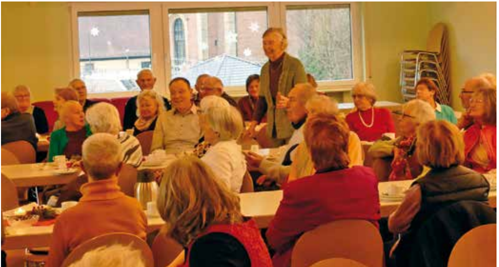
Viele Besucher kamen zum Kenia-Nachmittag