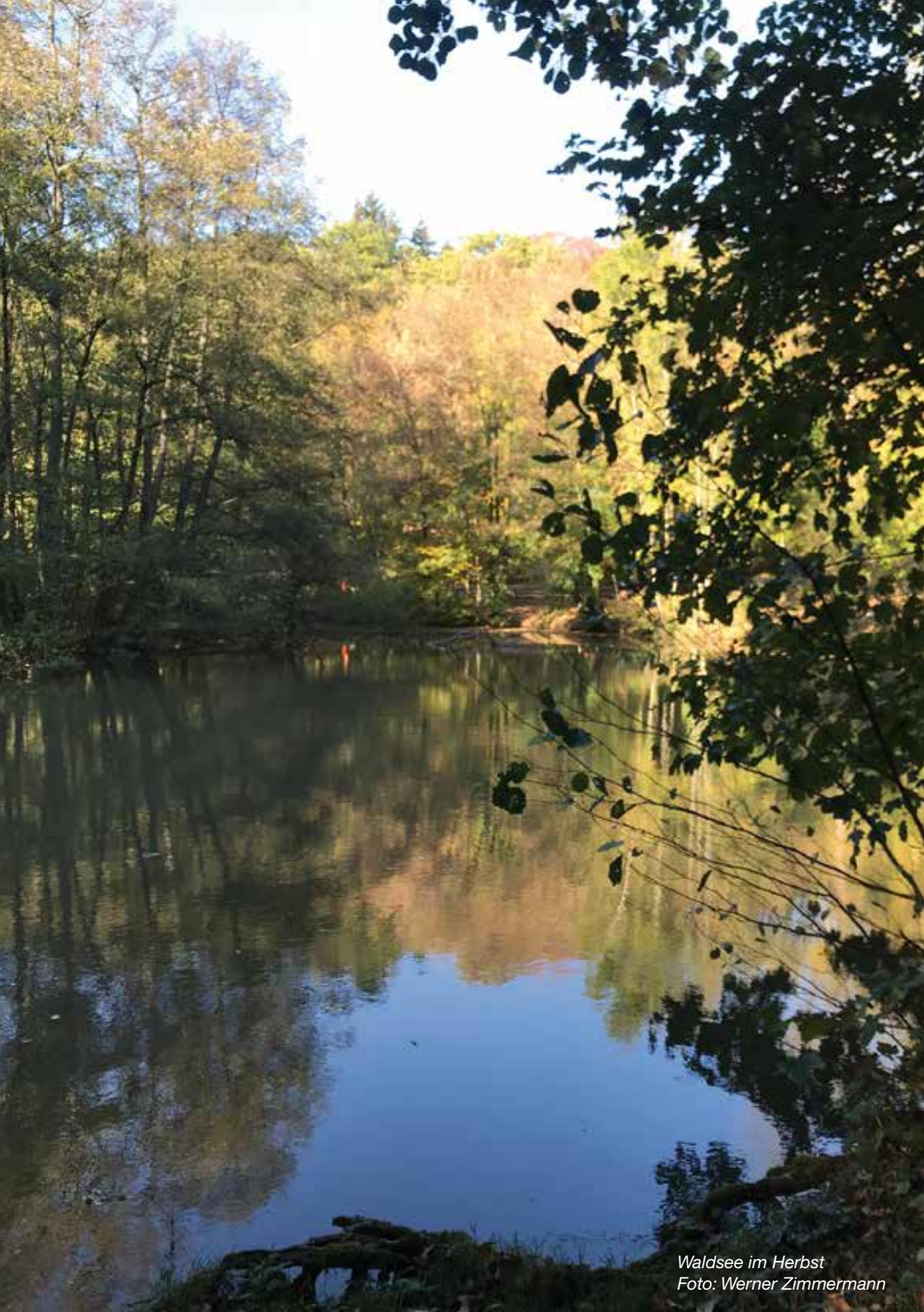
Waldsee im Herbst