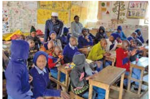
Schüler in Thiru

Evangelische Arbeitnehmerschaft Ortskern Oberöwisheim