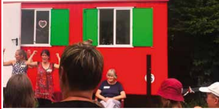
Impressionen vom Kindernachmittag